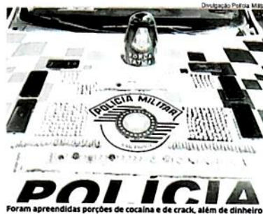
Foram apreendidas porções de cocaína e de crack, além de dinheiro

Itu – Na noite da última terça-feira (19), um rapaz de 21 anos, um de 20 anos e outro de 19 anos de idade foram presos suspeitos de traficar drogas no bairro Vila Lucinda, em Itu. Em meio a ocorrência, um homem de 46 anos acabou preso por quebra de medida protetiva. Segundo informações registradas em boletim de ocorrência, a Polícia Militar realizava patrulhamento quando avistou os jovens pulando a janela de um apartamento, promovendo então a abordagem. Em poder deles dos averiguados, foram localizadas 529 porções de crack e outras 48 contendo cocaína, além de R$ 202,00 em dinheiro. Foram apreendidos ainda no apartamento,